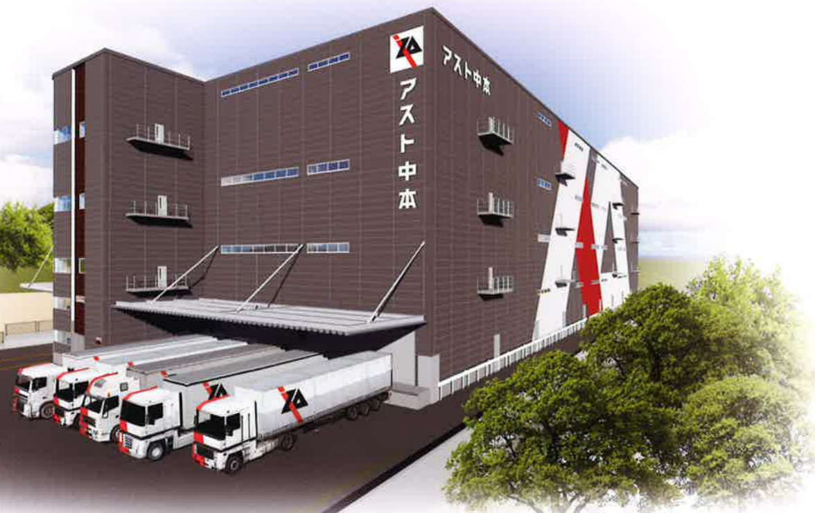
※外観CGは完成イメージです。